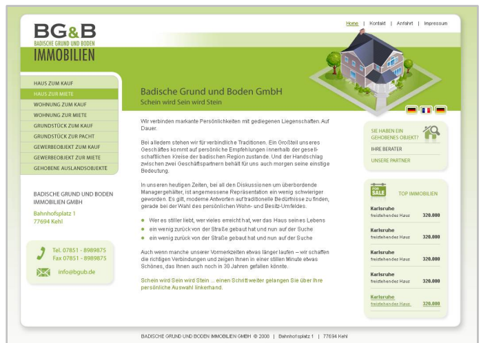
Abbildung 2 / Immobilien-Webseite mit vertikalen Navigation und News-System