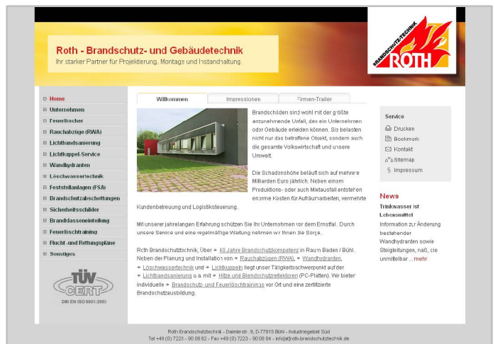
Abbildung 3 / Gewerbe-Webseite mit horizontaler Tab-Navigation und WebVideo