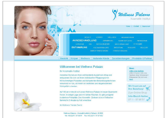
Abbildung 1 / Kosmetik-Webseite (Tag-Cloud, News-System mit RSS-Feed)