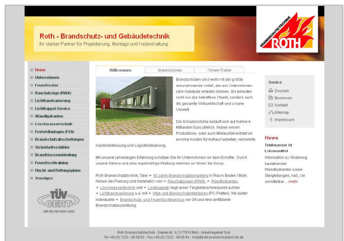
Abbildung 3 / Gewerbe-Webseite mit horizontaler Tab-Navigation und WebVideo