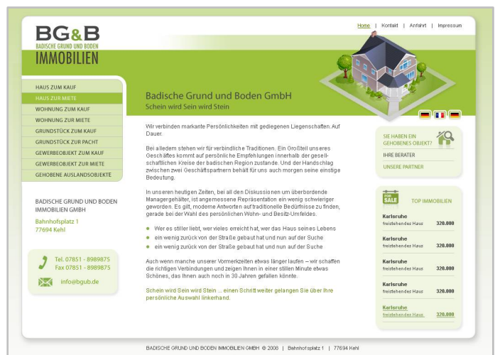
Abbildung 2 / Immobilien-Webseite mit vertikalen Navigation und News-System